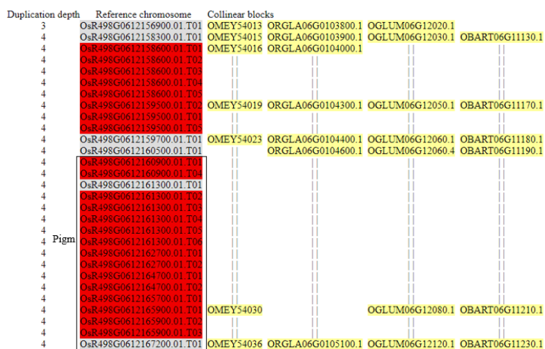
شکل ۳- خوشه‌های ژنی ژن‌های مقاومت به بیماری بلاست قرار گرفته بر روی کروموزوم شماره ۶ O. sativa indica کد OsR ( O. glaberrima ) ORGLA، ( O. meridionalis ) OMEY، ( O. sativa indica ) OBAR و ( O. glumipatula ) OGLUM، ( O. barthii ).